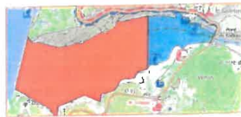
5/ Anse de Galotas (Aiguines/Moutiers) Depuis les murs du moulin jusqu'au cap de l'ouest de l'île jusqu'à la limite de la forêt domaniale en aval. 60 ha