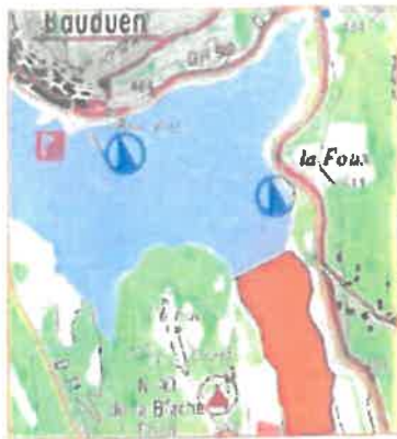
1/ Anse de Baudouin Le front de mer entre la maison de la chapelle du N.E. de la Bèche et le chemin en direction de la Bèche. 8 ha