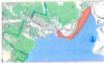
3/ Anse de Fout Collomb (Moutiers/Sta Marie) La zone littorale du plan d'eau. depuis la jonction avec la Plaine en direction au nord jusqu'à la limite de la forêt domaniale en aval. 10 ha