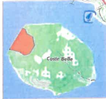
2/ Anse de Coste Belle (Salles/Verdon) Les 2 fronts de mer entre la salle de salle à l'ouest (47 km 0127) et le cap sur la pointe de Garchip - la passerelle de l'île marquée par les poteaux. 76 ha