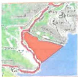
4/ Anse de Repentance (St-Croix du Verdon) Le front de mer entre une rap au nord et la passerelle 12 ha